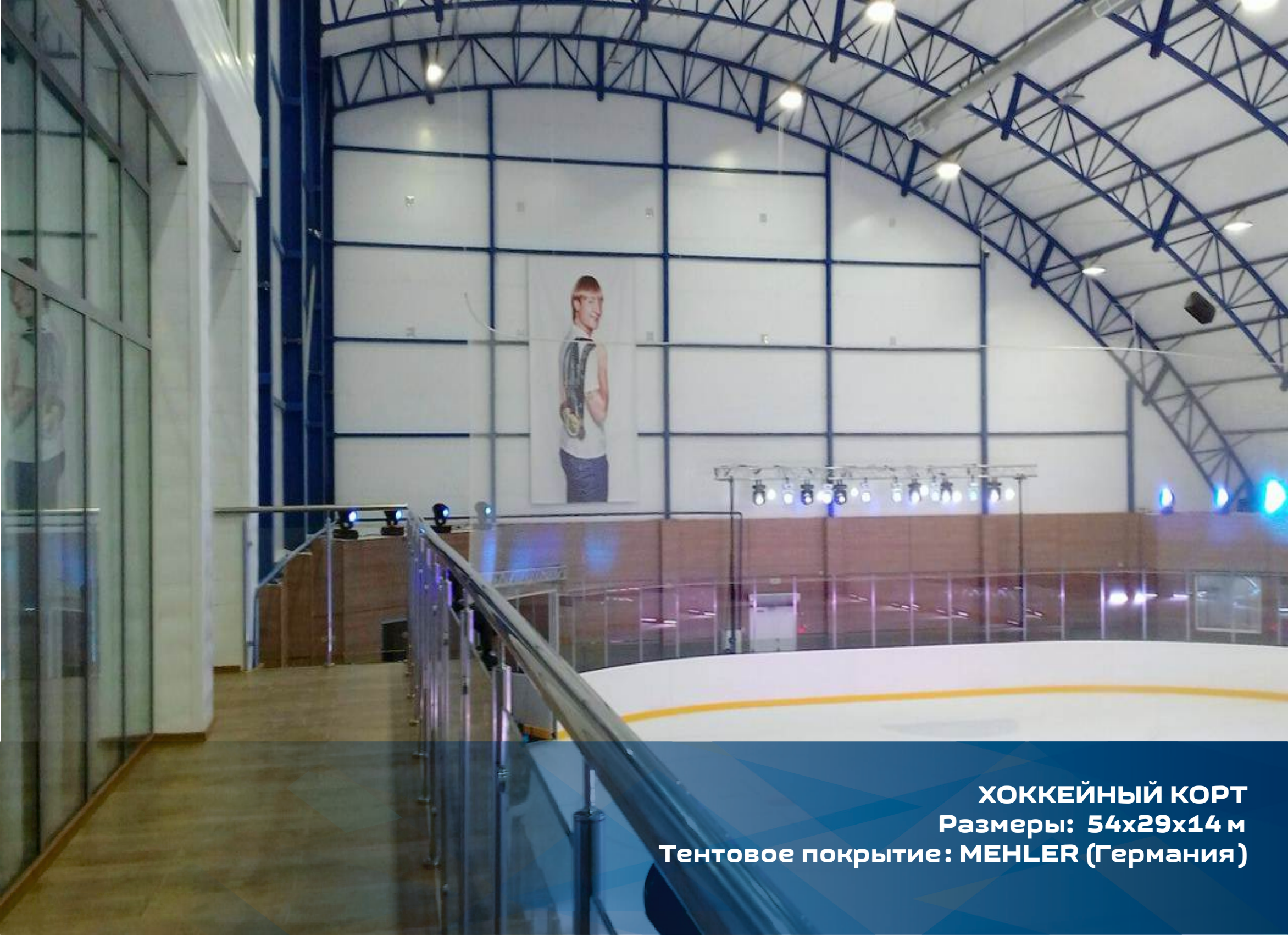
ХОККЕЙНЫЙ КОРТ Размеры: 54x29x14 м Тентовое покрытие: МЕНЛЕР (Германия)