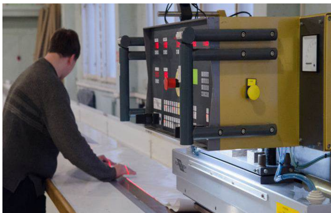
Высокочастотный аппарат для сварки "Forsstrom" (Швеция)

2017 г. ПЕРЕРАБОТАНО: БОЛЕЕ 1 000 000 М 2 ТЕНТОВОГО МАТЕРИАЛА БОЛЕЕ 1000 ТОНН МЕТАЛЛА