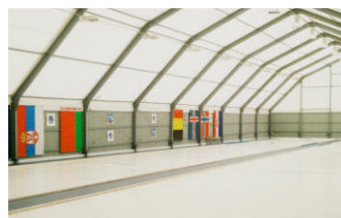
Зал для игр в керлинг Московская область