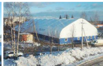
Учебно-тренировочный центр Республика Коми