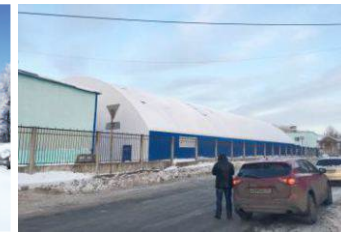
Реконструкция хоккейного катка Архангельская область