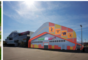
ФОК по художественной гимнастике Нижегородская область