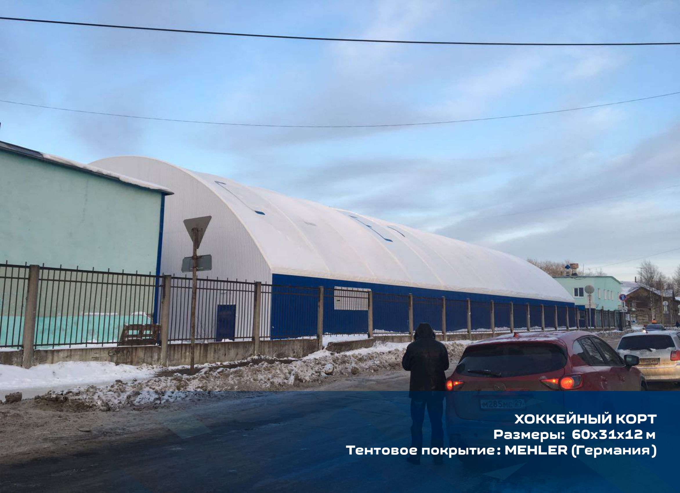
ХОККЕЙНЫЙ КОРТ Размеры: 60x31x12 м Тентовое покрытие: MENCHER (Германия)