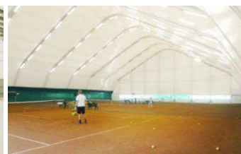
Укрытие теннисных кортов Московская область