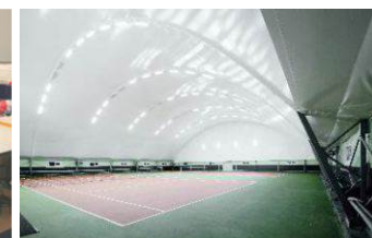
Укрытие теннисных кортов Московская область