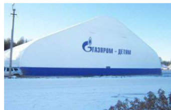
Укрытие хоккейного катка Архангельская область