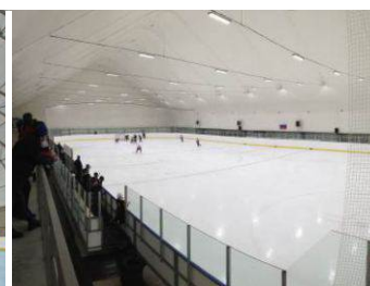
Укрытие хоккейного катка Челябинская область