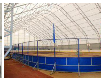
Укрытие хоккейного катка Республика Коми