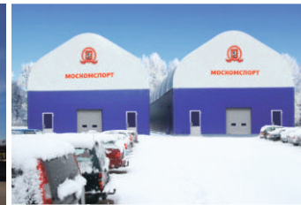
Комплекс для пляжных видов спорта Московская область