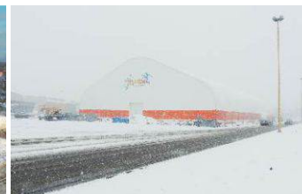
Центр пляжного спорта Ленинградская область