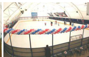
Ледовый каток Тюменская область