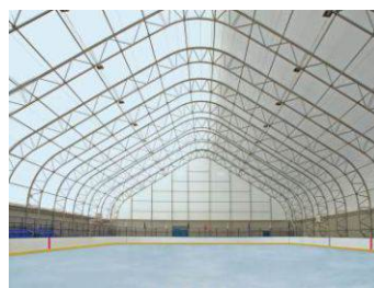
Ледовый каток Краснодарский край