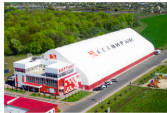
Картодром Белгородская область

Вся продукция соответствует системе менеджмента качества изготавливаемой продукции и подтверждена сертификатом качества ISO 9001-2011 (ISO 9001:2008). Сварные швы соответствуют требованиям ГОСТ 14771-76, ГОСТ 5264-80. Проверка сварных швов осуществляется с применением ультразвуковых дефектоскопов.