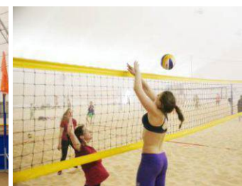
Центр пляжного спорта Ленинградская область